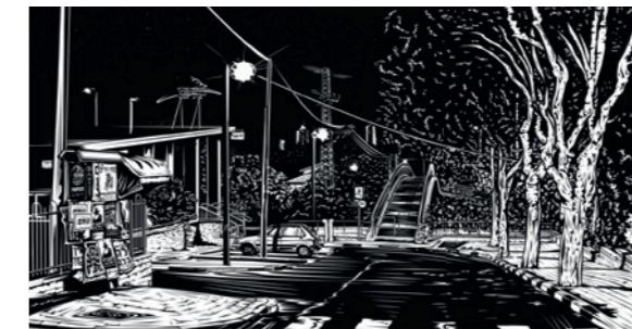
Herzliya, Grafik von Nir Peled

KOSTENFREI | KEINE ALTERSBESCHRÄNKUNG | KEINE ANMELDUNG ERFORDERLICH