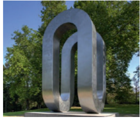
»Endlosschleife« von Josef Neuhaus im Stadtgarten Neuss

5 € | ERWACHSENE | ANMELDUNG UNTER WWW.CLEMENS-SELS-MUSEUM-NEUSS.DE